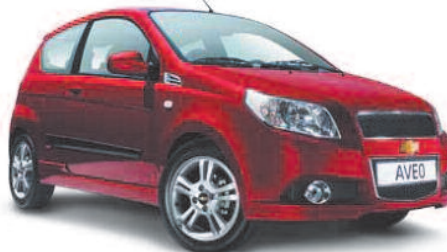
3 ajtós Aveo 1.2 Base