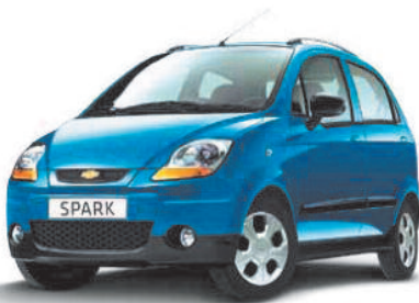
Spark 0.8 Base

Szeretne végre egy igazán jó hírt hallani? Chevrolet modelljeink még kedvezőbb áron kaphatók! Válogasson a legújabb Aveo, Spark és Cruze modellek közül és vigye haza új Chevrolet-jét már 1 799 000 forintért! További részletekért látogasson el márkakereskedésünkbe. www.chevrolet.hu