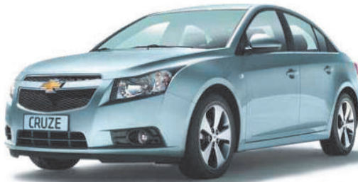
Cruze 1.6 Base